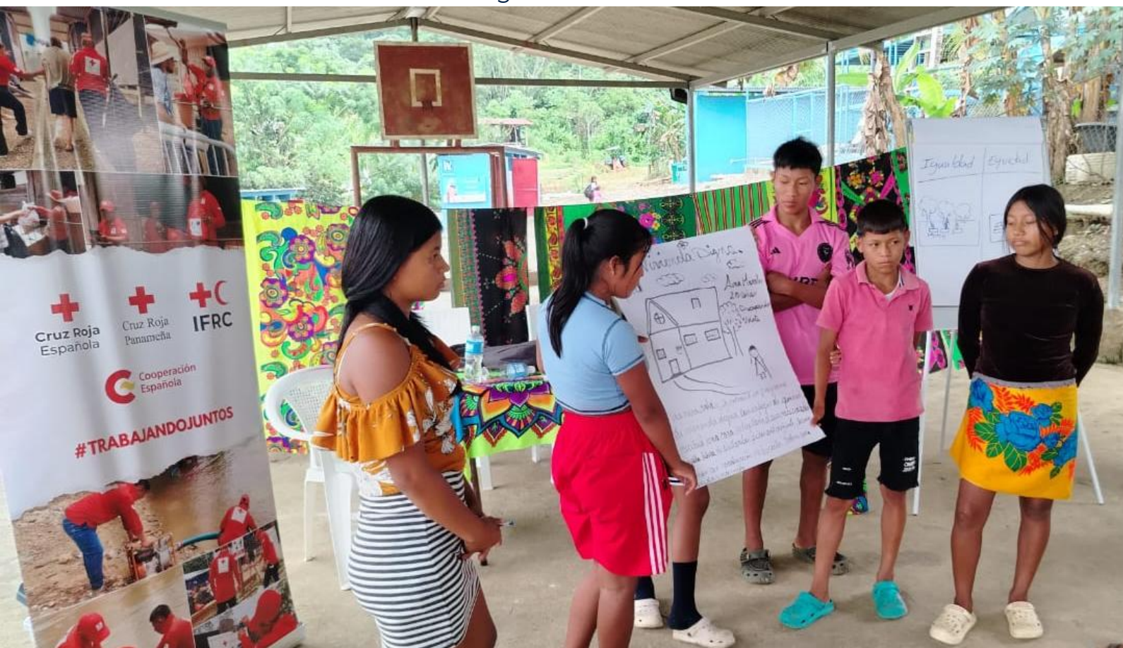
Taller de sensibilización sobre protección, género e inclusión en Bajo Chiquito y Canaán Membrillo, Darién, agosto 2025.