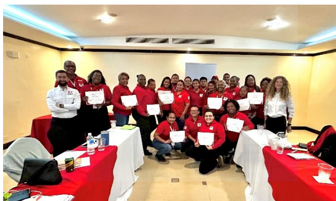
Taller de Diplomacia Humanitaria, Colón, julio 2025.

Se realizó la réplica del taller de Diplomacia Humanitaria en contextos migratorios, facilitado por el equipo formado de la Sociedad Nacional, en colaboración con la Federación Internacional de Sociedades de la Cruz Roja y de la Media Luna Roja (IFRC). Esta actividad busca fortalecer las capacidades locales para la incidencia humanitaria y el abordaje integral de los desafíos que enfrentan las personas migrantes en tránsito.