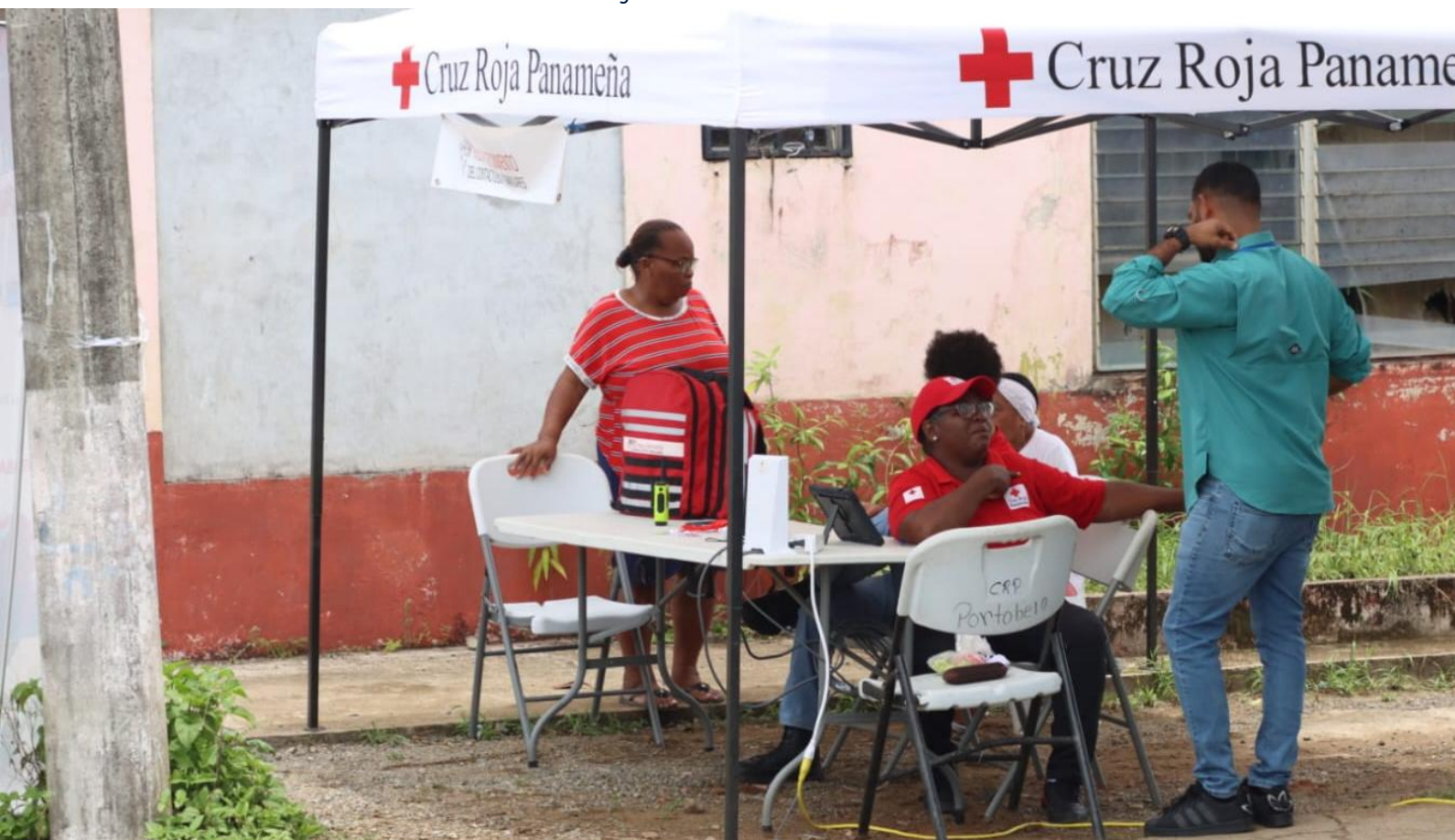
Prestación de servicios de Restablecimiento de Contactos Familiares (RCF) en Miramar, Colon, julio 2025.