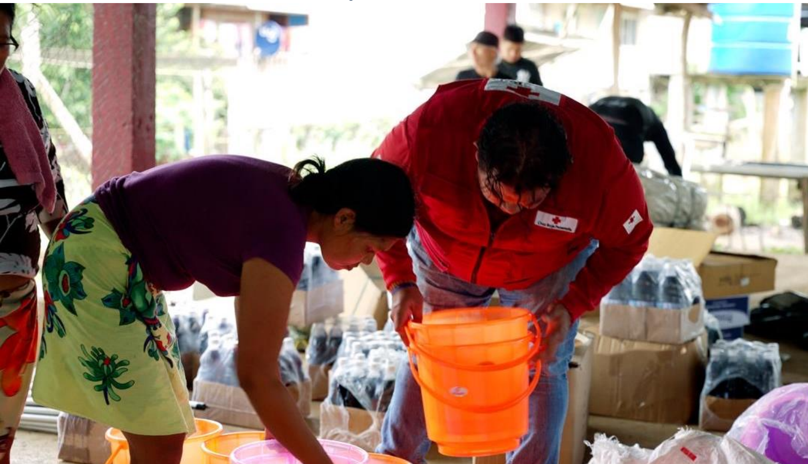
Distribución de insumos básicos para la higiene y limpieza del hogar a familias de la comunidad de Lajas Blancas, junio 2025.