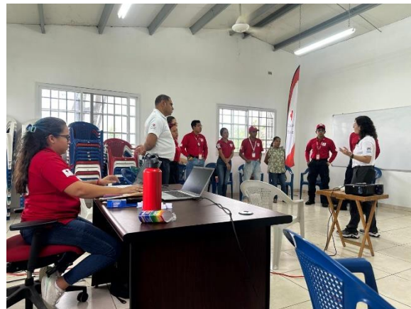
Taller formación rápida puntos de servicio humanitario (HSP), junio 2025.