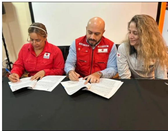
Firma de acuerdo de cooperación CR Panameña-CR Suiza, mayo 2025.

Asimismo, se firmó un acuerdo de cooperación con la Cruz Roja Suiza, en el marco del fortalecimiento de la preparación integral para una respuesta eficaz ante emergencias, desastres y otras crisis humanitarias. Este acuerdo representa un paso significativo hacia la consolidación de alianzas que potencien la capacidad de respuesta humanitaria en la región.