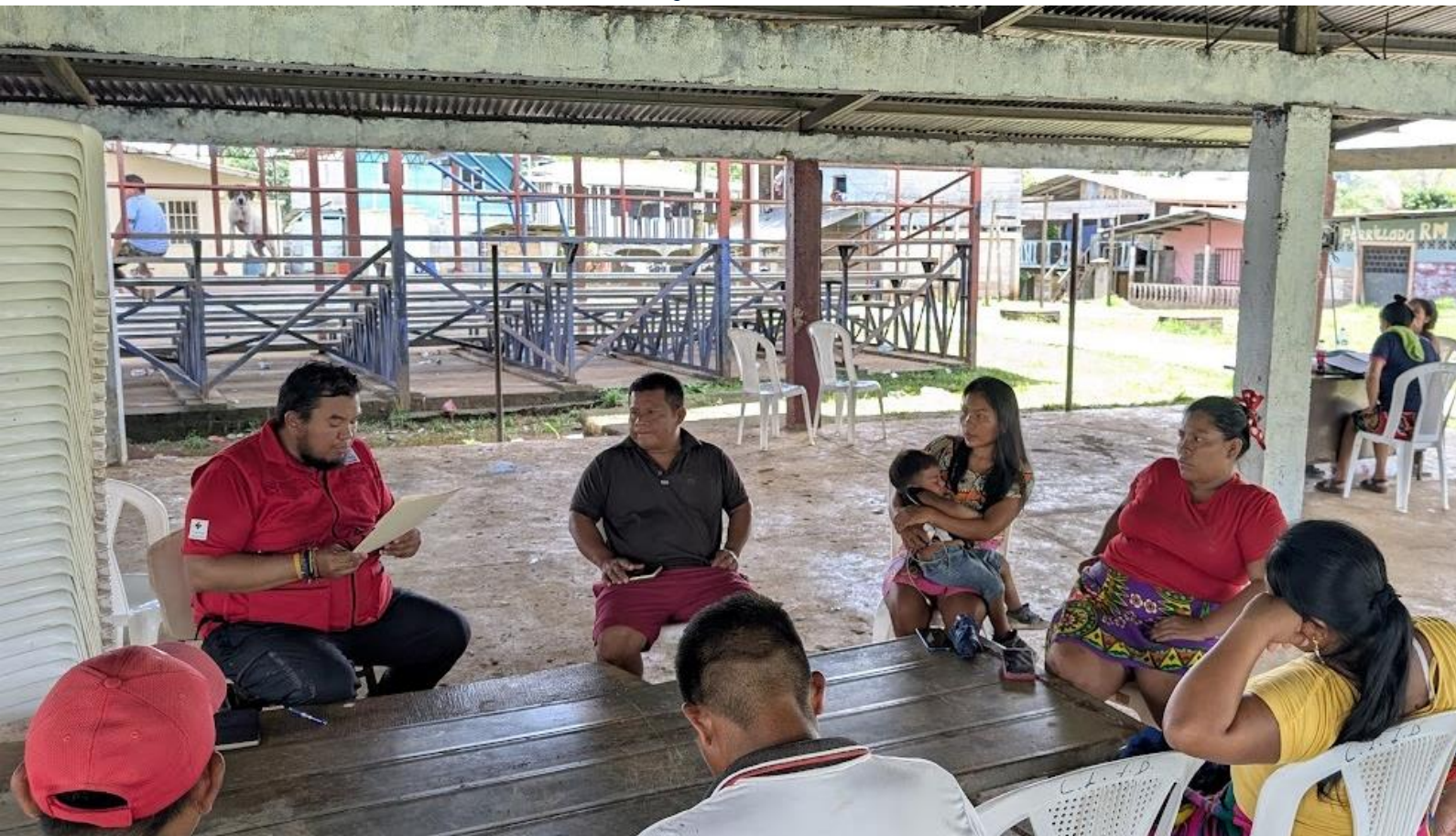
Reunión con el Comité comunitario de gestión de residuos, Lajas Blancas, mayo 2025.