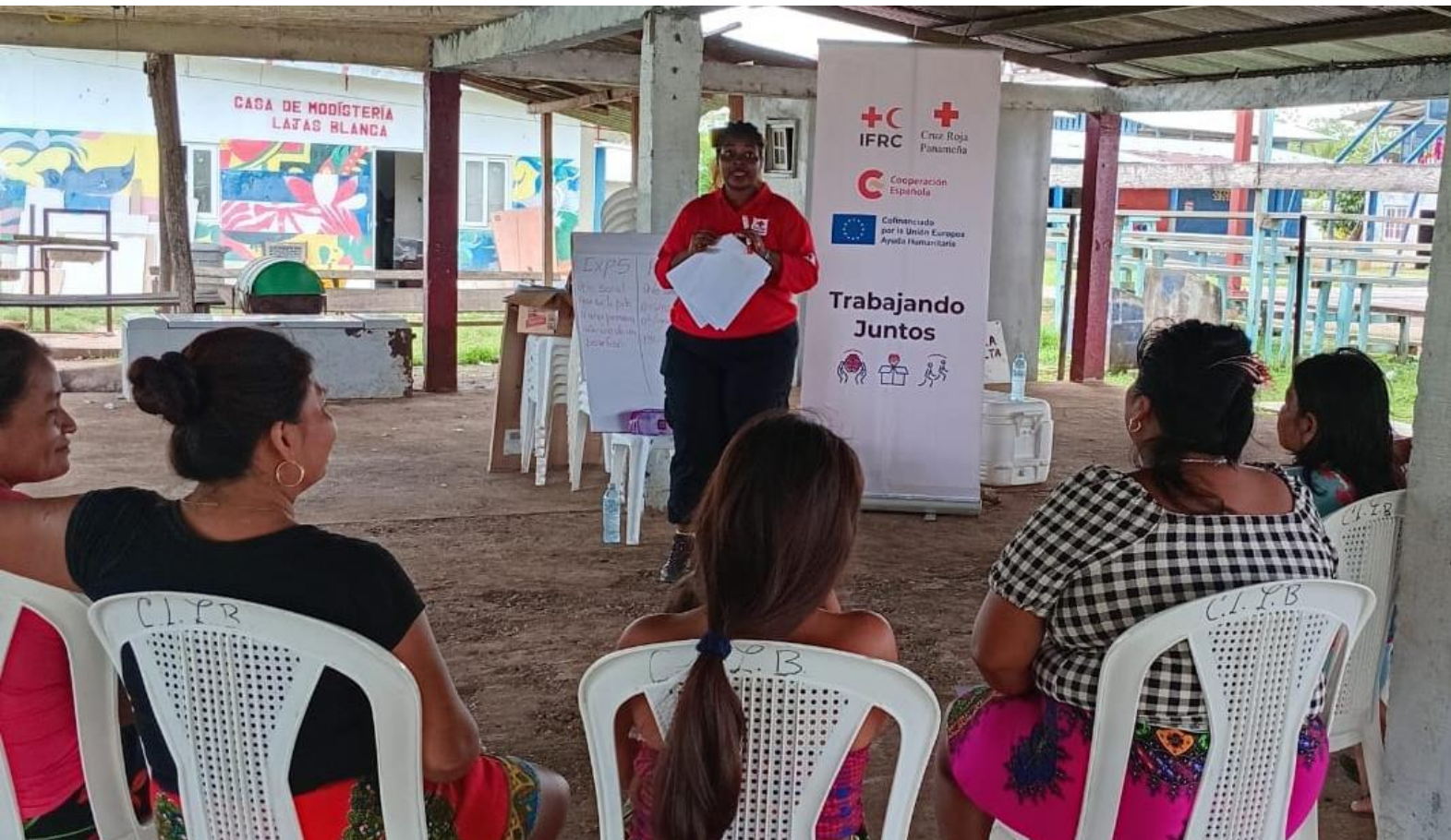
Taller de prevención de explotación y abuso sexual, Lajas Blancas, abril 2025.