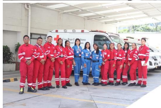
Curso de Formación de Formadores en SPAC, Medellín, Colombia, abril 2025.