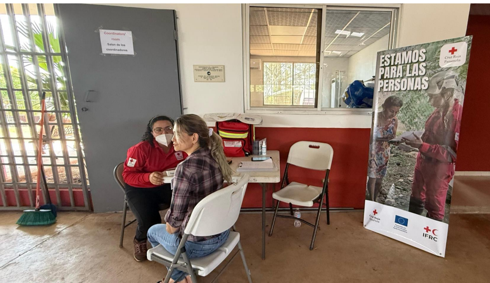
Voluntarios de Cruz Roja Panameña brindan servicios de atención médica en el centro de acogida temporal Fe y Alegría, marzo 2025.