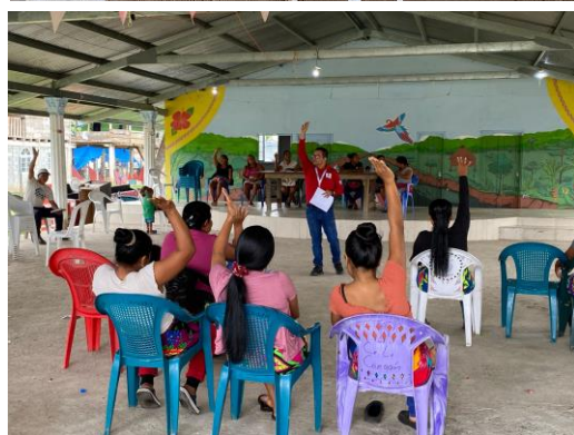
Jornadas de Rendición de cuentas a la comunidad en Bajo Chiquito y Canaán Membrillo, marzo 2025.