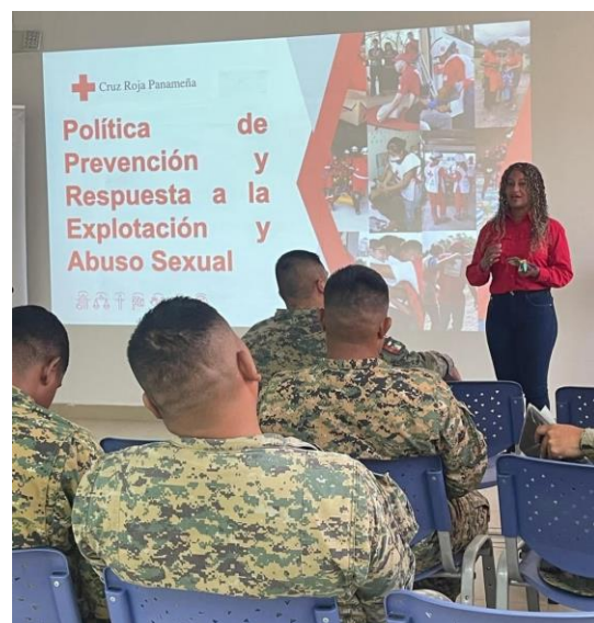
Taller PEAS, Metetí, Darién. Enero 2025.

Con la realización de este taller, la Cruz Roja Panameña reafirma su compromiso con la protección de los derechos y la dignidad de las personas en situaciones de riesgo, avanzando en su misión de promover un entorno seguro y respetuoso para todos. Este esfuerzo subraya la importancia de una respuesta efectiva y preventiva contra cualquier forma de explotación y abuso.