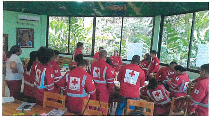
Descripción Primer curso piloto de GDR

Plan Nacional de Respuesta aprobado en Asamblea No. 86 de la CRP